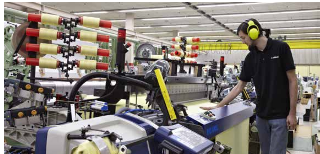
Weberei DELCOTEX in Jöllenbeck

Die DELIUS-Gruppe setzt sich im Rahmen des betrieblichen Gesundheitsmanagement (BGM) für ein gesundheitsförderndes Arbeitsumfeld ein, wahrt die Gesundheit und gewährleistet die Arbeitssicherheit um Unfälle und Verletzungen zu vermeiden.