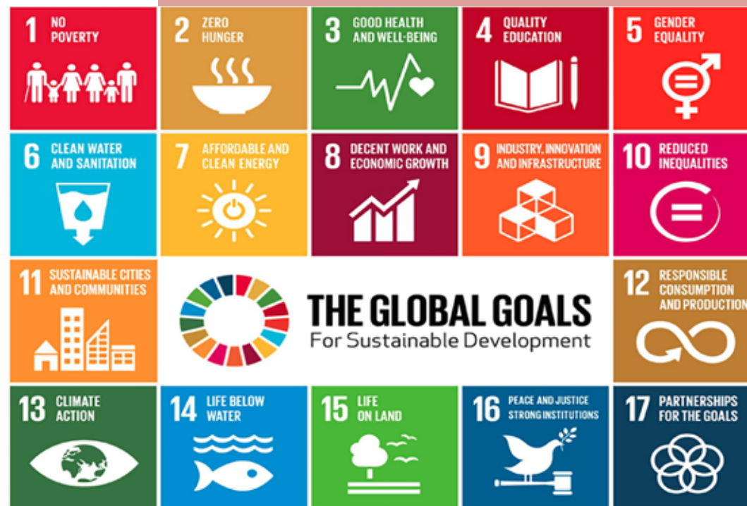
Agenda 2030: Unsere Nachhaltigkeitsziele | Bundesregierung

Wir orientieren uns an den 17 Global Goals für Nachhaltige Entwicklung der Vereinten Nationen: