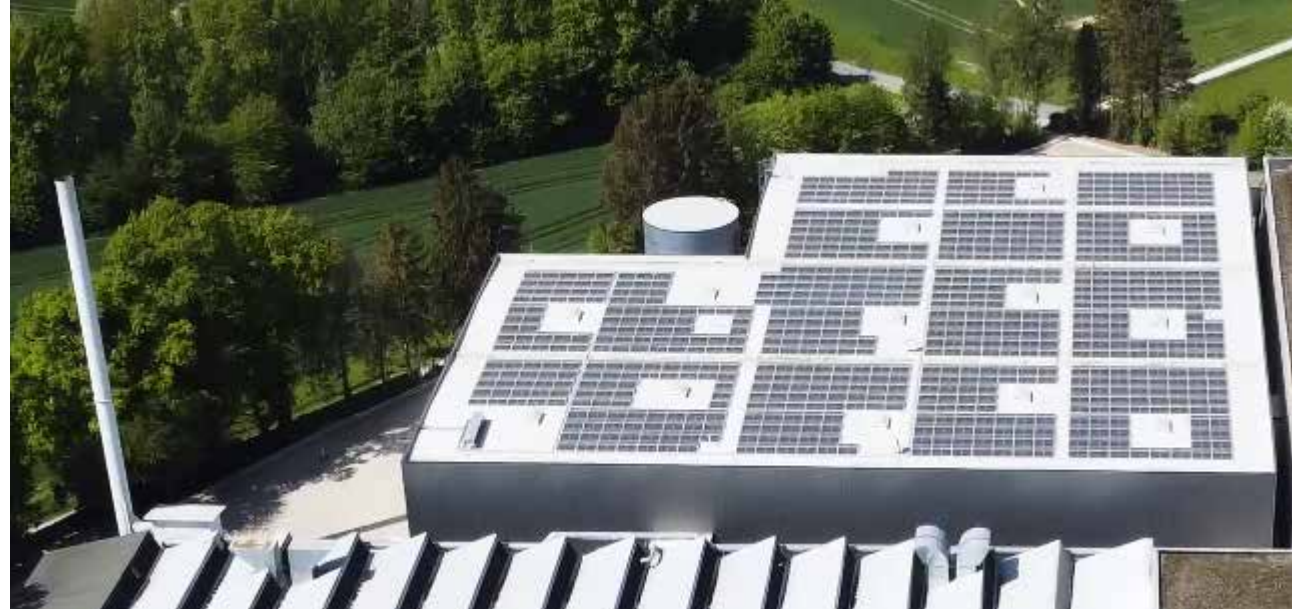
Photovoltaikanlage neue Lagerhalle DELCOTEX in Jöllenbeck

Wir haben gemeinsam MA's, FK's und Gesellschaftern im Rahmen des Strategie – Entwicklungsprozess für 2027 unsere Werte überprüft und teilweise überarbeitet, insbesondere Nachhaltigkeit ist für die langfristige Entwicklung der Unternehmensgruppe von grundlegender Bedeutung.