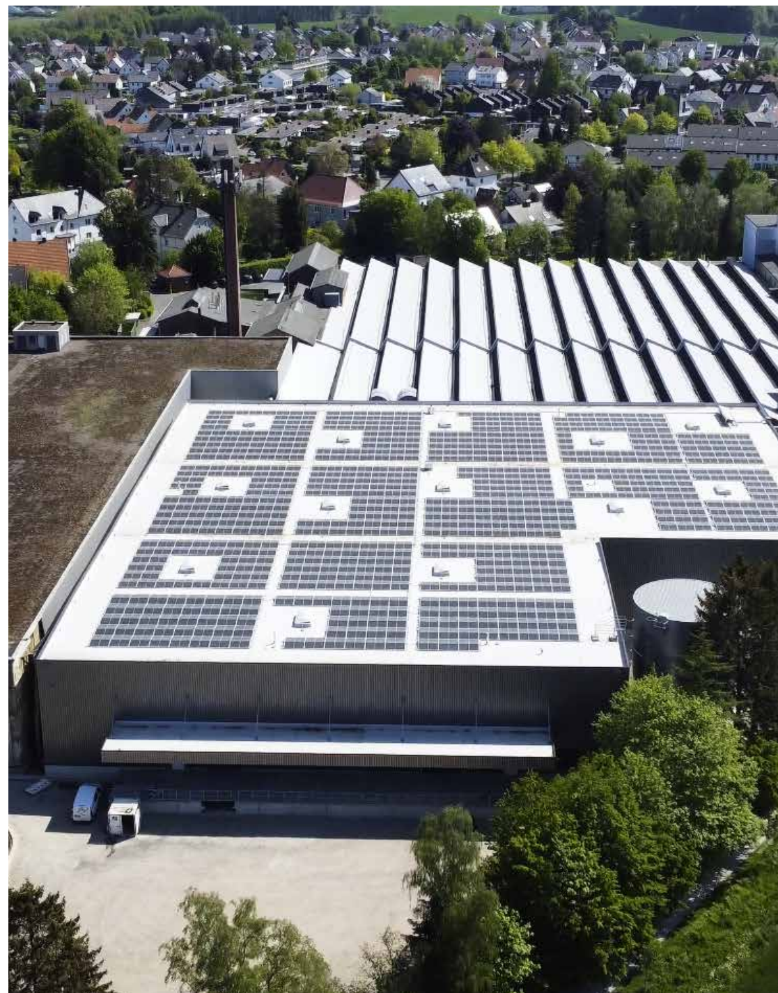
Photovoltaikanlage neue Lagerhalle DELCOTEX in Jöllenbeck