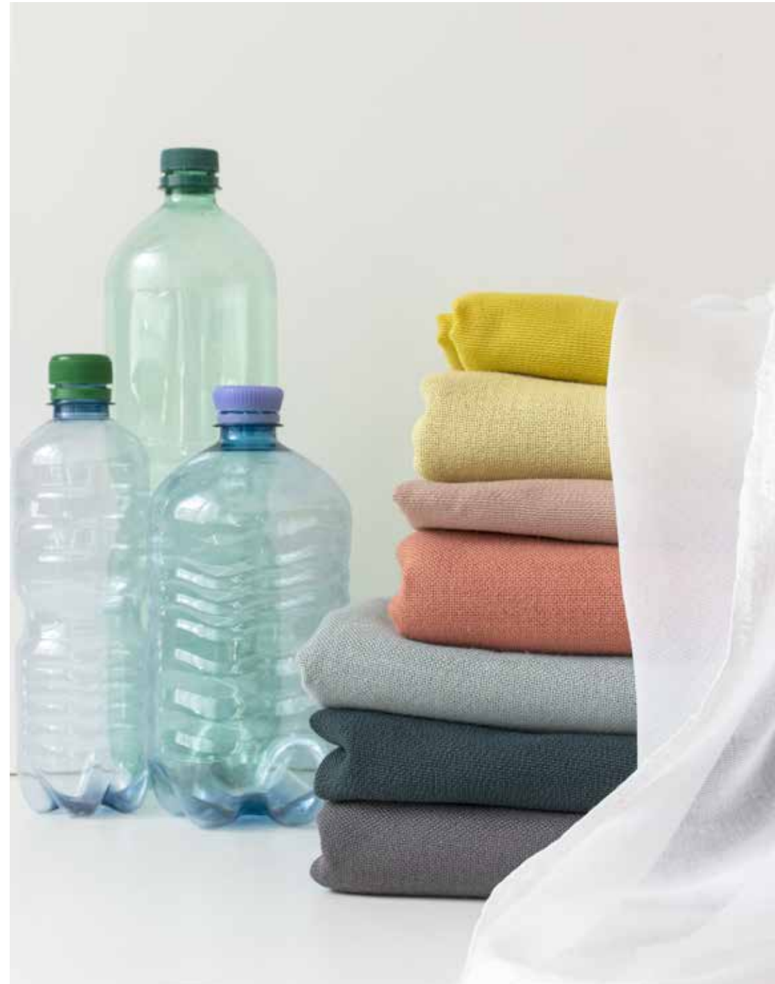
EcoLine Vorhangstoffe aus recycelten PET-Flaschen