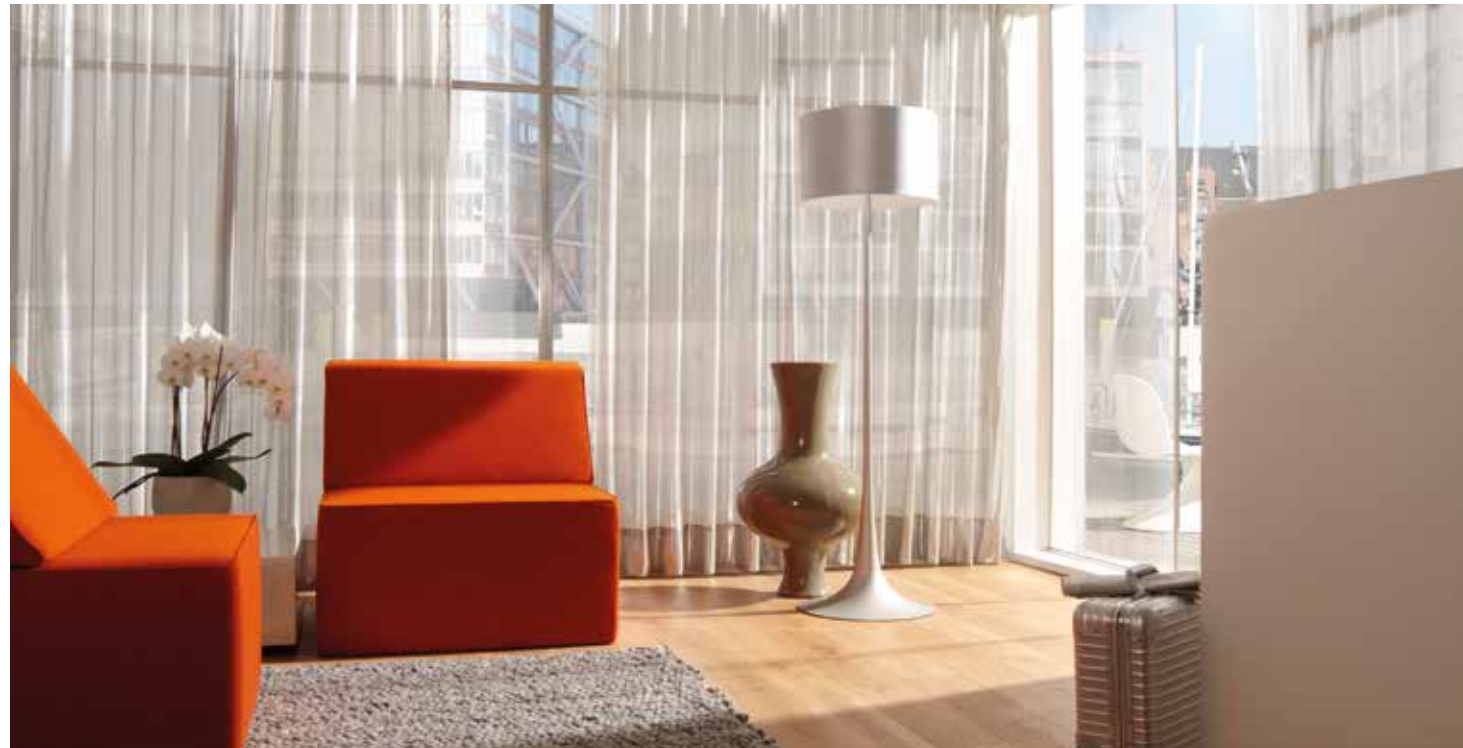
Energieeffiziente DELITHERM-Vorhangstoffe von DELIUS